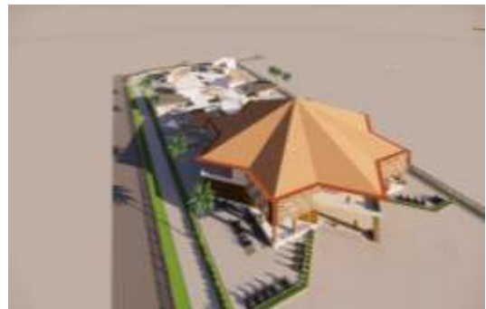
Gambar 9. Fasad