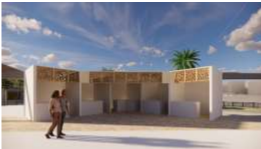
Gambar 6. Eksterior belakang