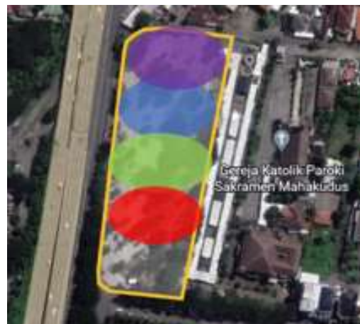
Gambar 3. Zoning Ruang

Analisa zoning, penzoningan dilakukan dengan tujuan untuk pembagian yang termasuk publik, semi publik, privat, juga meliputi area hijau. Pembagian zoning juga di atur sesuai besar kecilnya faktor bising dan kegiatan agar peletakan ruang lebih sesuai dengan fungsi ruang.