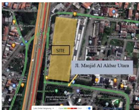
Gambar 1. Analisa Pencapaian

Analisa pencapaian, pertama yaitu akses menuju tapak dapat diakses dari pintu masuk di sisi selatan tapak yaitu depan masjid, dengan melewati jalan utama yaitu Jl. Masjid Al – Akbar Utara. Kedua, akses menuju tapak dapat melalui pintu masuk di sisi barat tapak dengan melewati jalan utama yaitu Jl. Gayungsari Barat. Secara keseluruhan rencana perancangan pencapaian entrance utama berada pada sisi selatan.