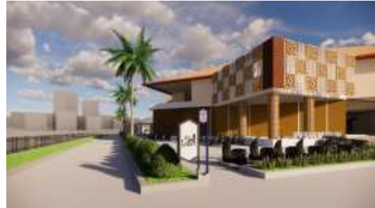
Gambar 8. Signage 2