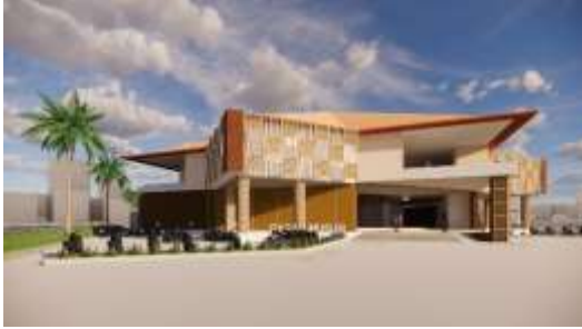
Gambar 4. Eksterior depan