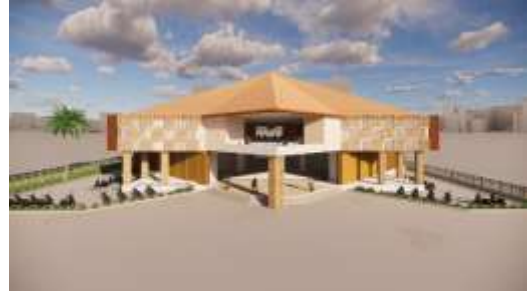
Gambar 2. Tampilan Bentuk "segi delapan"