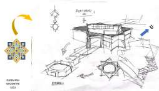
Gambar 5. Sketsa Gubahan Bentuk

Konsep gubahan massa, bentukan bangunan per masa berasal dari geometri segi delapan, lalu disempurnakan menjadi bentuk bangunan yang proposional dan unity .