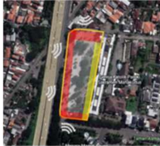
Gambar 2. Analisa Kebisingan

utara, dari tapak yang disebabkan karena lokasi tapak berdekatan langsung dengan jalan utama.