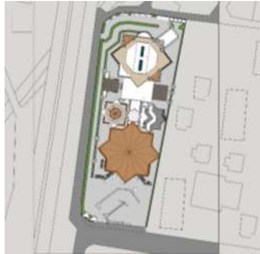
Gambar 3. Site Plan