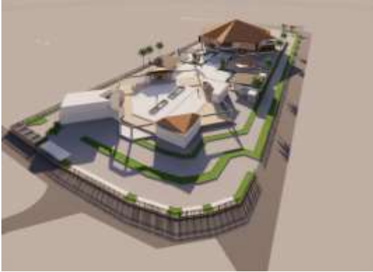
Gambar 10. View belakang