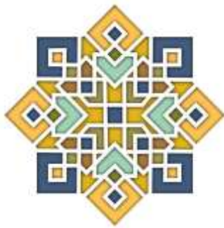
Gambar 4. Geometri Islam

Konsep transformasi, konsep transformasi bangunan diambil dari sebuah prinsip islami yang dikemukakan oleh tokoh Bernama (Utaberta). Utaberta menuliskan ada delapan prinsip arsitektur islam. Dari kedelapan prinsip itu juga dapat dihubungkan dengan salah satu simbol yang sering muncul dalam arsitektur islam, yaitu “segi delapan”, bentukan segi delapan merupakan gubahan bentuk yang sederhana yang dimana kesederhanaan merupakan salah satu prinsip islam pada poin kedua yaitu “untuk mengingat pada tuhan”.