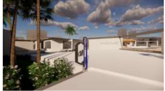
Gambar 7. Signage 1