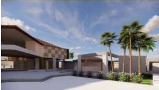
Gambar 5. Eksterior tengah